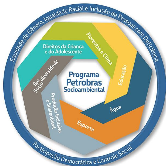
Figura 1 - Linhas de Atuação do Programa Petrobras Socioambiental

O Programa Petrobras Socioambiental patrocina projetos que estejam inseridos em pelo menos uma das seguintes linhas de atuação: Produção Inclusiva e Sustentável; Biodiversidade e Sociodiversidade; Direitos da Criança e do Adolescente; Florestas e Clima; Educação; Água; e Esporte.